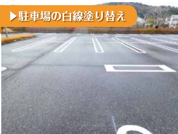
▶ 駐車場の白線塗り替え