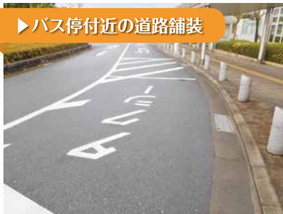
▶ バス停付近の道路舗装