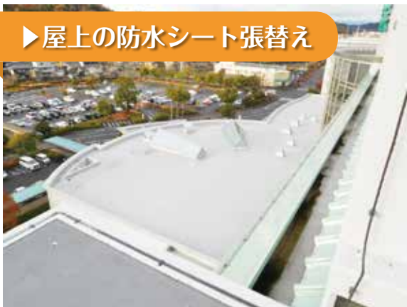
▶ 屋上の防水シート張替え